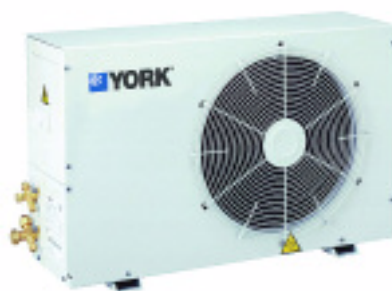
CHC/CHH Unidade externa condensadora

* Para a instalação da parte embutida da unidade interna, necessita-se de uma altura mínima de 35 cm em relação ao teto.